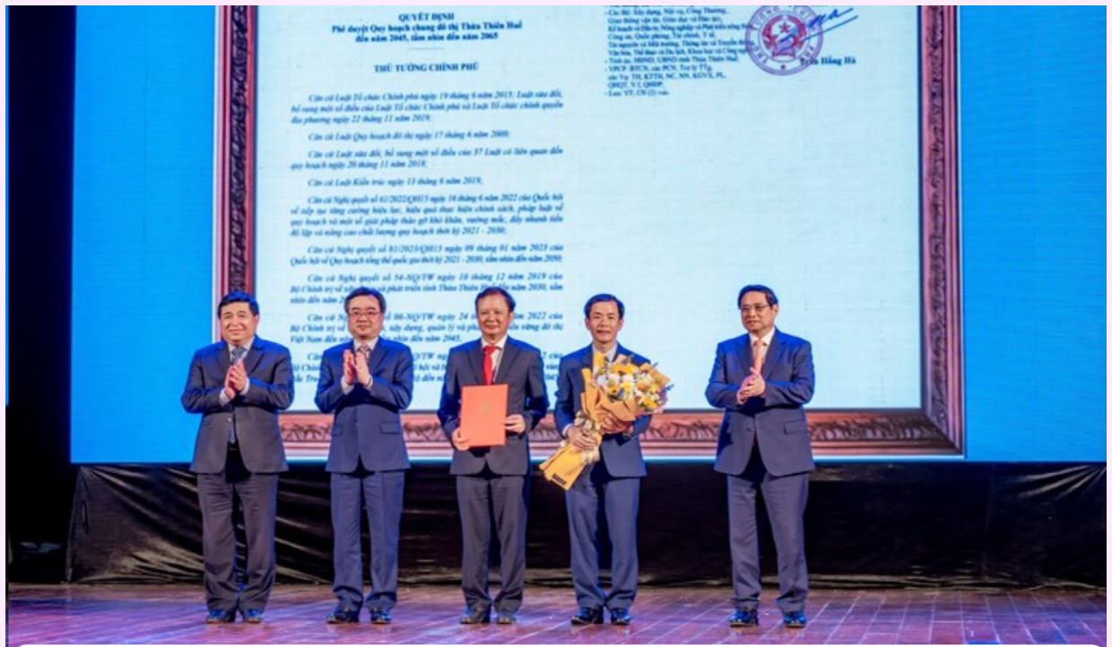
Thủ tướng Chính phủ Phạm Minh Chính trao quyết định công bố Quy hoạch chung đô thị tỉnh Thừa Thiên Huế đến năm 2045, tầm nhìn đến năm 2065

đề năm 2025 trở thành thành phố trực thuộc Trung ương nếu đủ điều kiện.