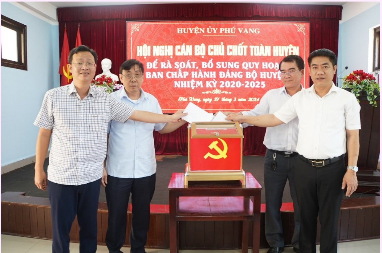
Bỏ phiếu bổ sung quy hoạch các chức danh Ủy viên Ban Chấp hành Đảng bộ huyện nhiệm kỳ 2020-2025