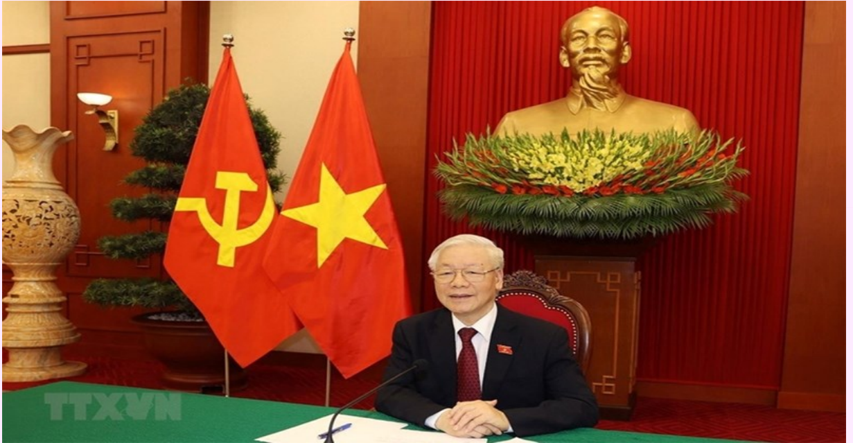
Tổng Bí thư Nguyễn Phú Trọng điện đàm với Tổng thống Liên bang Nga Vla-đi-mia Pu-tin