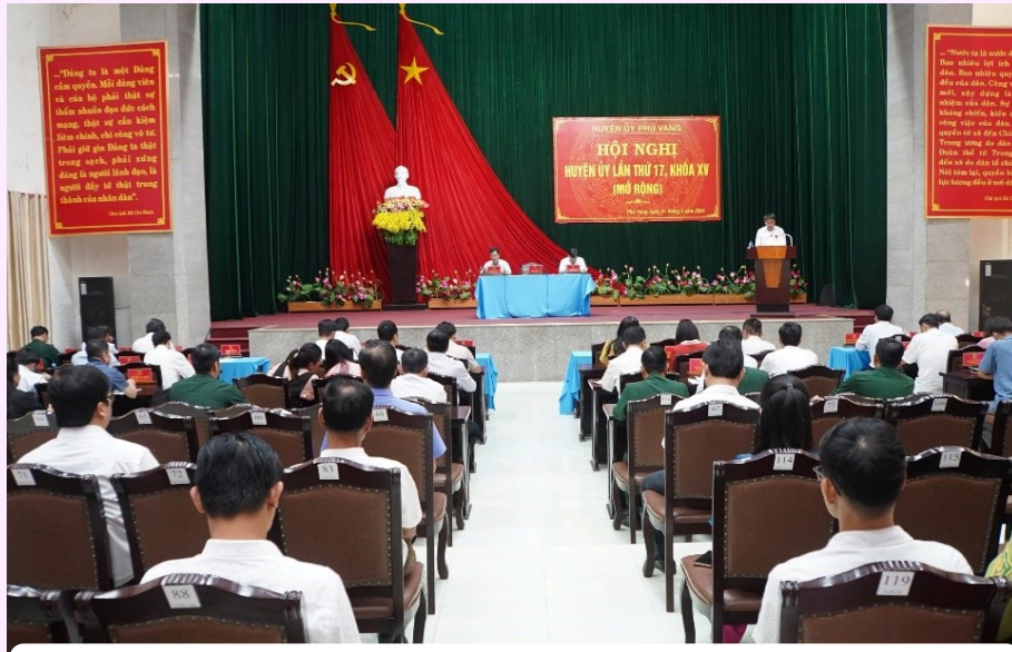
Tại Hội nghị