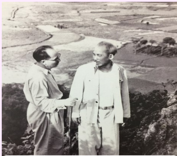
Chủ tịch Hồ Chí Minh và Phó Chủ tịch nước Nguyễn Lương Bằng

Không chỉ là người suốt đời thực hành và là tấm gương mẫu mực trong thực hành đạo đức cách mạng, đồng chí Nguyễn Lương Bằng còn là một trong những người đầu tiên đề xuất việc tích cực học tập, rèn luyện đạo đức cách mạng của Chủ tịch Hồ Chí Minh, coi đó là nhiệm vụ quan trọng của mỗi đảng viên. Theo Đồng chí, học tập, noi gương Chủ tịch Hồ Chí Minh là học tập, noi gương những quan điểm của Người về “Đảng viên phải hết lòng, hết sức phục vụ Nhân dân chứ không phải để ngồi trên đầu, trên cổ Nhân dân, phục vụ cho mình, phục vụ cho gia đình mình. Đảng viên phải cần, kiệm, liêm, chính, chí công vô tư, phải thật sự phản đối quan liêu, lãng phí, tham ô, cá nhân chủ nghĩa”. Đó là học tập quan điểm “Lối sống cách mạng là lối sống có lập trường giai cấp, có quan điểm quần chúng, có kỷ luật tự giác và đạo đức cách mạng”; quan điểm “Lối sống có quan hệ mật thiết đến nhân phẩm và đạo đức của người đảng viên, đến ảnh