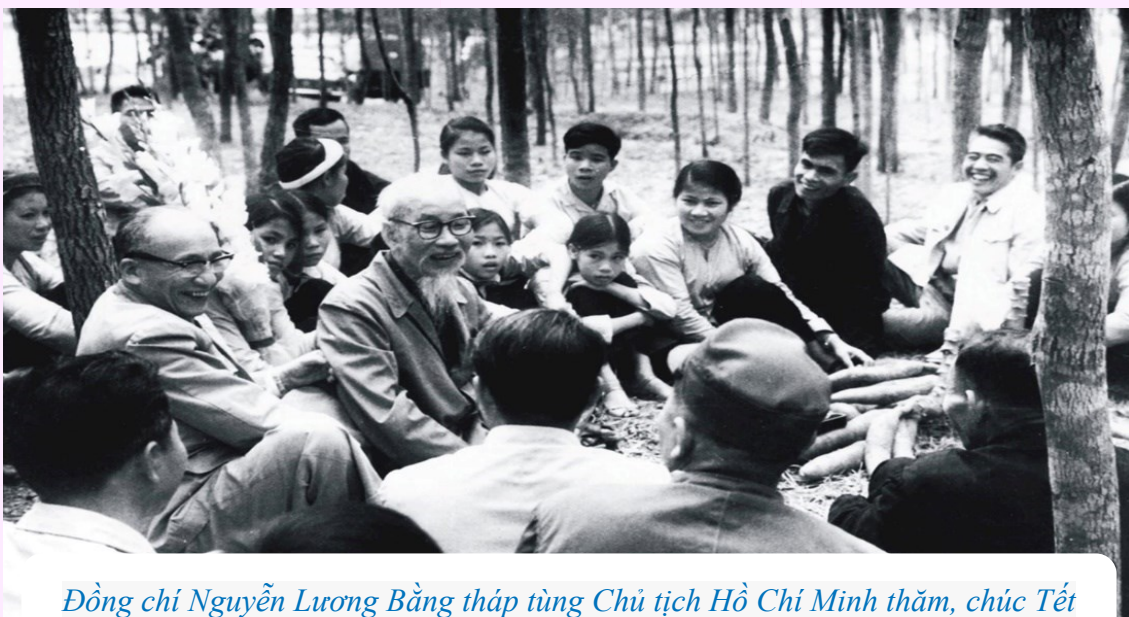
Đồng chí Nguyễn Lương Bằng tháp tùng Chủ tịch Hồ Chí Minh thăm, chúc Tết Nhân dân xã Vật Lại, huyện Ba Vì, tỉnh Hà Tây ngày 16/02/1969

Đấu tranh vì lý tưởng độc lập dân tộc và chủ nghĩa xã hội, nhiều lần bị địch bắt, đày ải. Trong nhà tù và trên đường bị địch áp giải, Đồng chí vẫn tranh thủ tuyên truyền, giác ngộ binh lính địch, chỉ cho họ hiểu rõ nỗi thống khổ của đồng bào và trách nhiệm phải giải phóng Nhân dân, vạch trần chế độ bất công trong quân đội địch, sự ngược đãi của bọn chỉ huy với binh lính. Những năm tháng bị giam cầm, mặc cho chế độ nhà tù đày ải khắc nghiệt, Đồng chí vẫn trước sau như một, luôn nêu cao khí tiết của người cộng sản, tinh thần