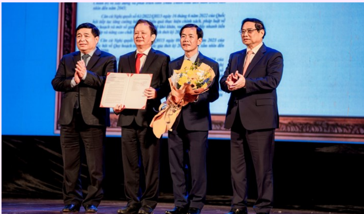
Thủ tướng Chính phủ Phạm Minh Chính trao quyết định công bố Quy hoạch tỉnh thời kỳ 2021-2030, tầm nhìn đến năm 2050

Sáng ngày 06/4, UBND tỉnh Thừa Thiên Huế long trọng tổ chức Hội nghị công bố Quy hoạch và xúc tiến đầu tư tỉnh Thừa Thiên Huế năm 2024 nhằm công bố Quy hoạch tỉnh thời kỳ 2021 - 2030, tầm nhìn đến năm 2050; Quy hoạch chung đô thị đến năm 2045, tầm nhìn đến năm 2065 đã được Thủ tướng Chính phủ phê duyệt, cũng như giới thiệu, quảng bá tiềm năng, lợi thế, định hướng phát triển của tỉnh Thừa Thiên Huế đến với các nhà đầu tư trong nước và quốc tế.