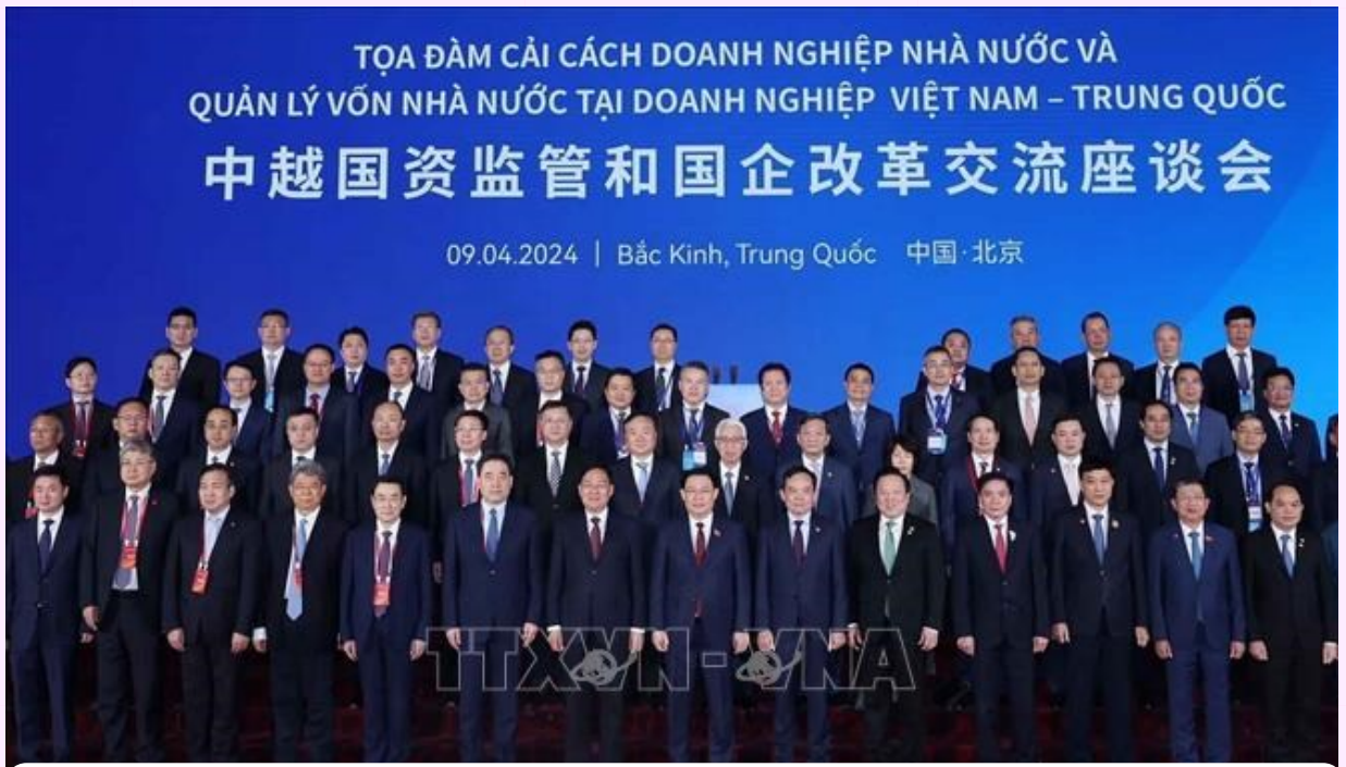
Chủ tịch Quốc hội Vương Đình Huệ với các đại biểu tham dự tọa đàm “Cải cách doanh nghiệp Nhà nước và quản lý vốn Nhà nước tại doanh nghiệp Việt Nam - Trung Quốc”

thiết lập cơ chế hợp tác liên nghị viện do Chủ tịch Quốc hội Việt Nam và Ủy viên trưởng Nhân đại toàn quốc Trung Quốc đồng chủ trì, thể hiện mức độ hợp tác tin cậy cao nhất giữa nghị viện các nước. Cơ quan lập pháp hai nước sẽ thúc đẩy các hình thức như: trao đổi đoàn, tổ chức khóa bồi dưỡng nghiên cứu, đào tạo, hội thảo chuyên đề, thúc đẩy hợp tác giữa Hội đồng Nhân dân và Nhân đại địa phương