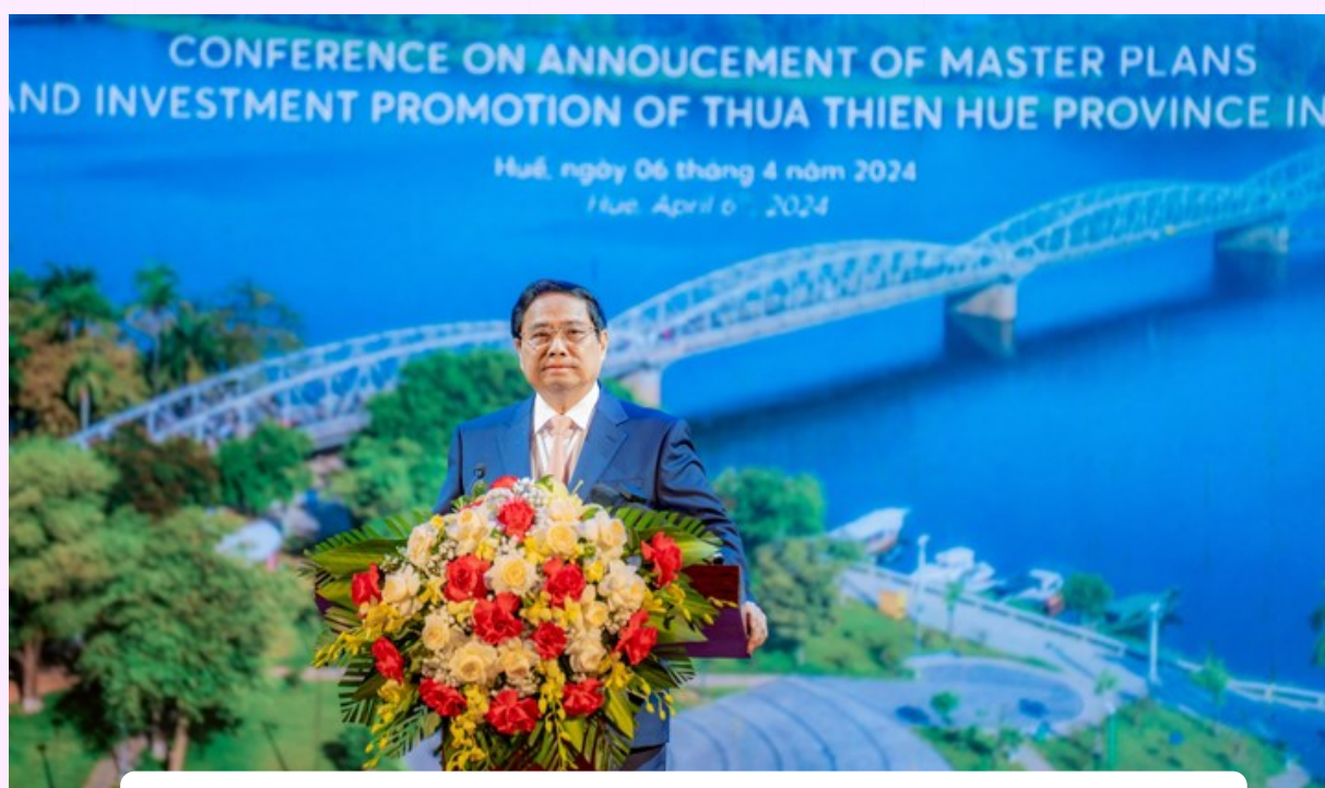
Thủ tướng Chính phủ Phạm Minh Chính phát biểu tại Hội nghị

Thủ tướng đề nghị cộng đồng doanh nghiệp, nhà đầu tư, cùng toàn thể các bộ, ngành và lãnh đạo các cấp của tỉnh Thừa Thiên Huế: Đã nói thì phải làm, đã cam kết thì phải thực hiện, đã thực hiện thì phải có kết quả thực chất, cân - đong - đo - đếm và lượng hóa được; tạo khí thế, động lực mới cho phát triển. Chúng ta