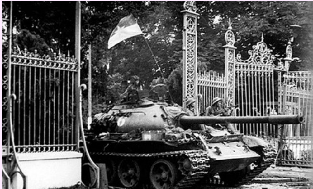
Xe tăng quân Giải phóng tiến vào chiếm Dinh Độc Lập ngày 30/4/1975.

Vào lúc 17 giờ ngày 26/4, quân ta đã nổ súng mở đầu chiến dịch, năm cánh quân của ta đã vượt qua tuyến phòng thủ của địch để tiến vào trung tâm Sài Gòn, đánh chiếm các cơ quan đầu não của chúng. 10 giờ 45 phút ngày 30/4, xe tăng và bộ binh của ta tiến vào Dinh Độc Lập, bắt toàn bộ Nội các của Sài Gòn, Dương Văn Minh vừa lên chức tổng thống ngày 28/4 đã phải tuyên bố đầu hàng quân ta không điều kiện. Đến 11 giờ 30 phút cùng ngày, lá cờ cách mạng tung bay trên Dinh Độc Lập, báo hiệu sự toàn thắng của chiến dịch Hồ Chí Minh lịch sử.