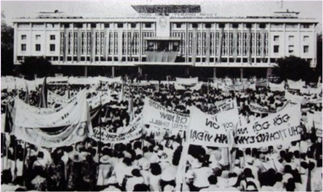
Các tầng lớp Nhân dân Sài Gòn tham dự mít tinh mừng chiến thắng. (Ảnh tư liệu)

Ngày nay, trong công cuộc đổi mới của đất nước, chúng ta mãi tự hào và biết ơn sự hy sinh to lớn của các Anh hùng, các thế hệ cha ông ta đã chiến đấu anh dũng vì độc lập tự do và thống nhất Tổ quốc. Chúng ta càng tự hào, tin tưởng vào sự lãnh đạo đúng đắn, sáng suốt tài tình của Đảng cộng sản Việt Nam, vào tinh thần quật cường bất khuất và trí thông minh,