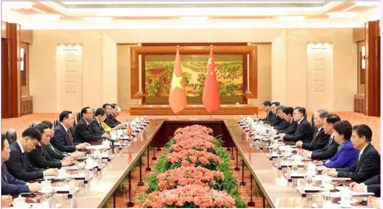
Chủ tịch Quốc hội Vương Đình Huệ hội đàm với Ủy viên trưởng Ủy ban Thường vụ Nhân đại toàn quốc Trung Quốc Triệu Lạc Tế.

Tại thủ đô Bắc Kinh, Chủ tịch Quốc hội Vương Đình Huệ đã hội kiến Tổng Bí thư, Chủ tịch Trung Quốc Tập Cận Bình;