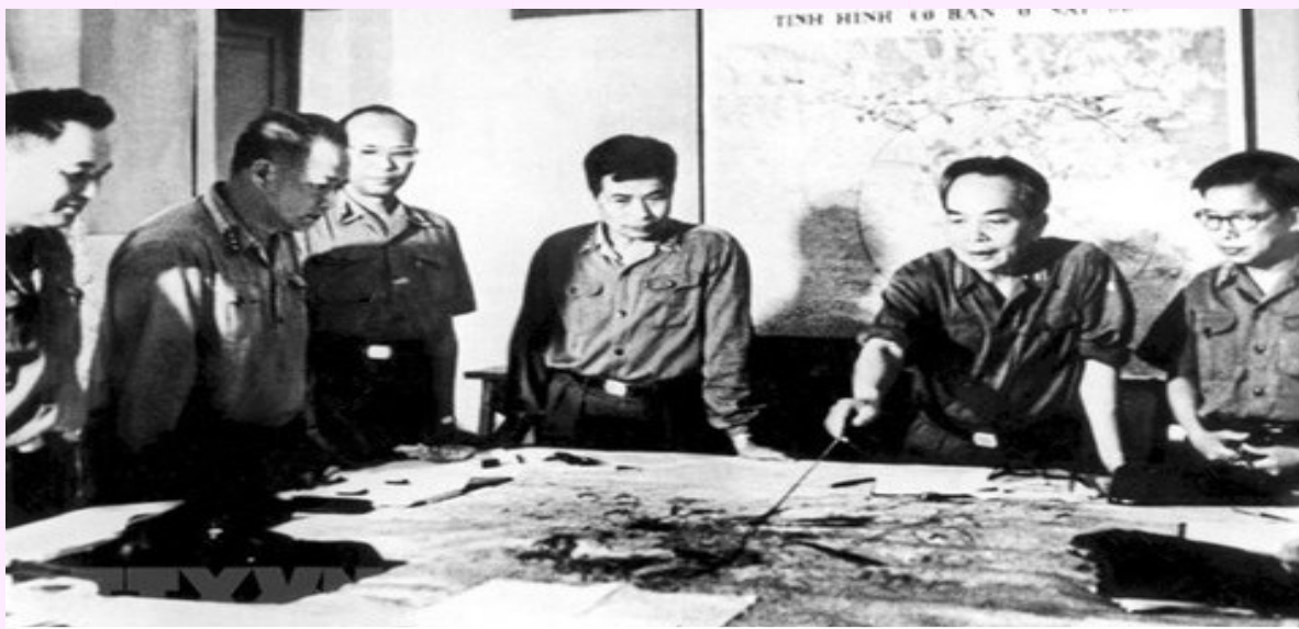
Quân ủy Trung ương theo dõi diễn biến của Chiến dịch Hồ Chí Minh

Vào cuối năm 1974 đầu năm 1975, nhận thấy tình hình so sánh lực lượng ở Miền Nam có sự thay đổi mau lẹ có lợi cho cách mạng, Bộ Chính trị Trung ương Đảng đã đề ra kế hoạch giải phóng hoàn toàn Miền Nam trong hai năm 1975 và 1976. Bộ Chính trị nhấn mạnh “Cả năm 1975 là thời cơ” và chỉ rõ “Nếu thời cơ đến vào đầu hoặc cuối năm 1975 thì lập tức giải phóng hoàn toàn Miền Nam trong năm 1975” . Bộ Chính trị cũng nhấn mạnh cần tranh thủ thời cơ đánh thắng nhanh để đỡ thiệt hại về người và của cho Nhân dân, giữ gìn tốt cơ sở kinh tế, công trình văn hóa, giảm bớt sự tàn phá của chiến tranh. Sau chiến thắng của quân ta ở Chiến dịch Tây Nguyên và chiến dịch Huế - Đà Nẵng, Bộ Chính trị đã nhận định: “thời cơ chiến lược đã đến, ta có điều kiện hoàn thành sớm quyết tâm giải phóng Miền Nam” và đã đưa ra quyết định: “phải tập trung nhanh nhất lực lượng, binh khí kỹ thuật và vật chất giải phóng Miền Nam trước mùa mưa” , đồng thời Chiến dịch giải phóng Sài Gòn - Gia Định được Bộ Chính trị quyết định mang tên