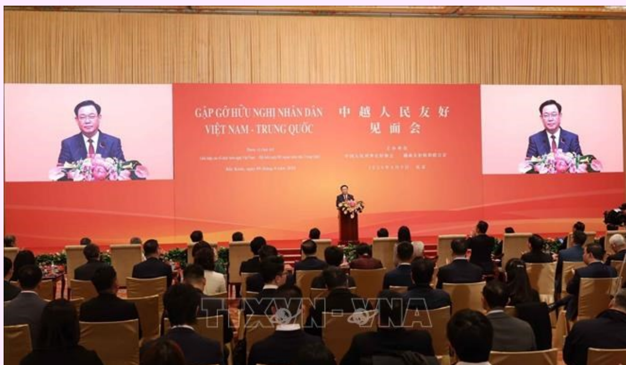
Chủ tịch Quốc hội Vương Đình Huệ phát biểu tại Gặp gỡ hữu nghị Nhân dân Việt Nam - Trung Quốc

Tại đây, Chủ tịch Quốc hội chia sẻ từ đầu thập niên của thế kỷ XX, các nhà cách mạng tiền bối của Việt Nam và Trung Quốc, dưới sự lãnh đạo của Chủ tịch Hồ Chí Minh và Chủ tịch Mao Trạch Đông, đã kề vai sát cánh, đoàn kết giúp đỡ, ủng hộ lẫn nhau, cùng nhau kết nên mối quan hệ thắm thiết “ vừa là đồng chí, vừa là anh em ”, ngày nay trở thành tài sản chung quý báu của hai Đảng, hai Nhà nước và Nhân dân hai nước, cần không ngừng gìn giữ, bồi đắp, trao truyền cho các thế hệ mai sau.