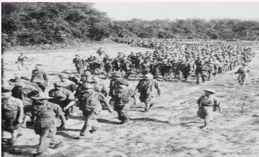
Tù binh Pháp ở Điện Biên Phủ lũ lượt ra hàng và được áp giải về tuyến sau.

Chủ tịch Hồ Chí Minh đã khẳng định " Chiến thắng Điện Biên Phủ như là một mốc son chói lọi bằng vàng của lịch sử ". Thắng lợi này đã trực tiếp đưa đến việc ký Hiệp định Geneve về chấm dứt chiến tranh lập lại hòa bình ở Đông Dương; tạo cơ sở và điều kiện để Nhân dân ta tiến lên giành thắng lợi trong cuộc kháng chiến chống Mỹ, cứu nước, giải phóng miền Nam, thống nhất đất nước vào năm 1975.