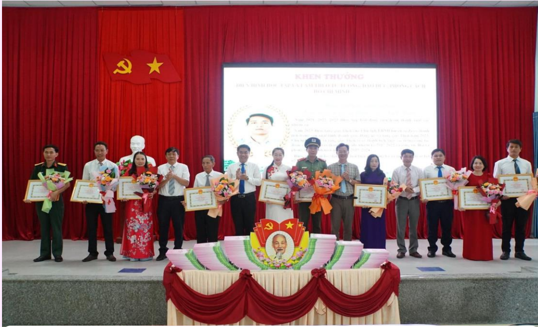
Tại Hội nghị sơ kết 03 năm thực hiện Kết luận 01-KL/TW của Bộ Chính trị