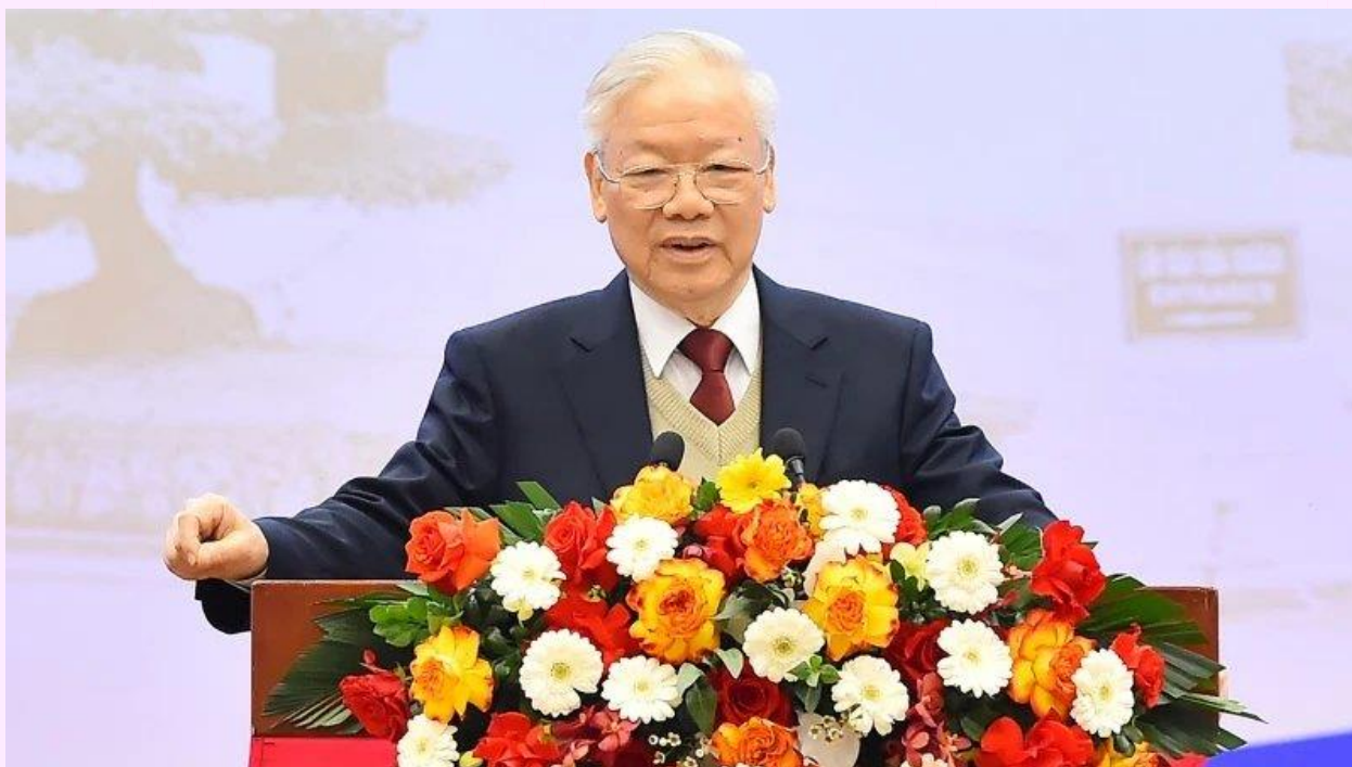
Tổng Bí thư Nguyễn Phú Trọng

B ài viết của Tổng Bí thư Nguyễn Phú Trọng nhân kỷ niệm 94 năm Ngày thành lập Đảng “ Tự hào và tin tưởng dưới lá cờ vẻ vang của Đảng, quyết tâm xây dựng một nước Việt Nam ngày càng giàu mạnh, văn minh, văn hiến và anh hùng ”, đã nhìn lại, đánh giá một cách khách quan, toàn diện những kết quả, thành tựu và bài học kinh nghiệm chủ yếu mà Đảng ta, Đất nước ta, Dân tộc ta đã đạt được qua các chặng đường lịch sử từ khi Đảng ra đời (03/02/1930), lãnh đạo cách mạng Việt Nam cho đến nay và từ nay đến năm 2030, kỷ niệm 100 năm Ngày thành lập Đảng.