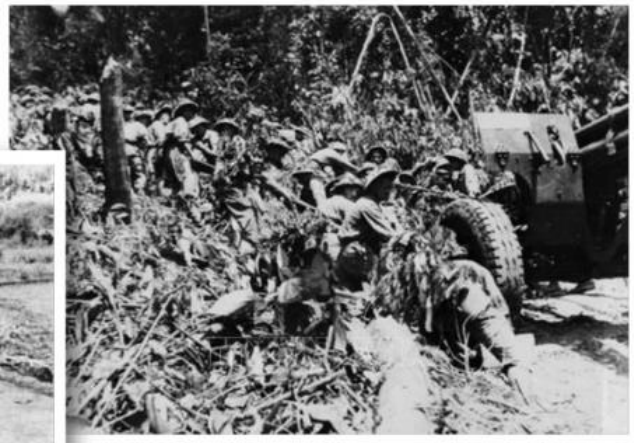
Ảnh trái: 21.000 xe đạp thồ, 261.500 dân công cùng các loại ô tô, tàu, thuyền, lừa, ngựa... ngày đêm vận chuyển lương thực, vũ khí, đạn dược lên mặt trận Điện Biên Phủ. Sự đóng góp to lớn của lực lượng dân công, đảm bảo hậu cần cho chiến dịch là một trong những nguyên nhân chính làm nên chiến thắng. Ảnh phải: Bộ đội ta kéo những khẩu pháo nặng hàng chục tấn vượt núi, xuyên rừng vào chiến trường Điện Biên Phủ.

Trong Chiến dịch Điện Biên Phủ, hàng vạn dân công đã tham gia tải thương, gửi lương thực, thực phẩm, vũ khí, trang bị vào phục vụ chiến trường; xé núi, bạt đèo cho bộ đội ta kéo pháo vào trận địa. Chỉ tính riêng Nhân dân tỉnh Thanh Hóa đã đưa ra tiền tuyến 9.000 tấn gạo, Nhân dân tỉnh Lai Châu đóng góp cho Điện Biên Phủ 2.666 tấn gạo, 226 tấn thịt; 210 tấn rau xanh, huy động 16.972 dân công, tham gia 517.210 ngày công; 348 ngựa thồ, 58 thuyền mảng, đóng góp 25.070 cây gỗ để làm đường.