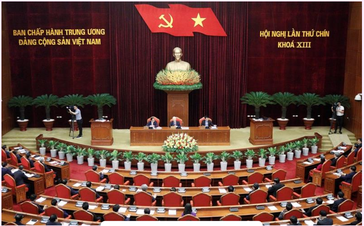
Hình ảnh Hội nghị.

T hực hiện Chương trình làm việc toàn khóa, từ ngày 16/5 đến ngày 18/5/2024, tại Thủ đô Hà Nội, Ban Chấp hành Trung ương Đảng khóa XIII họp Hội nghị lần thứ chín.