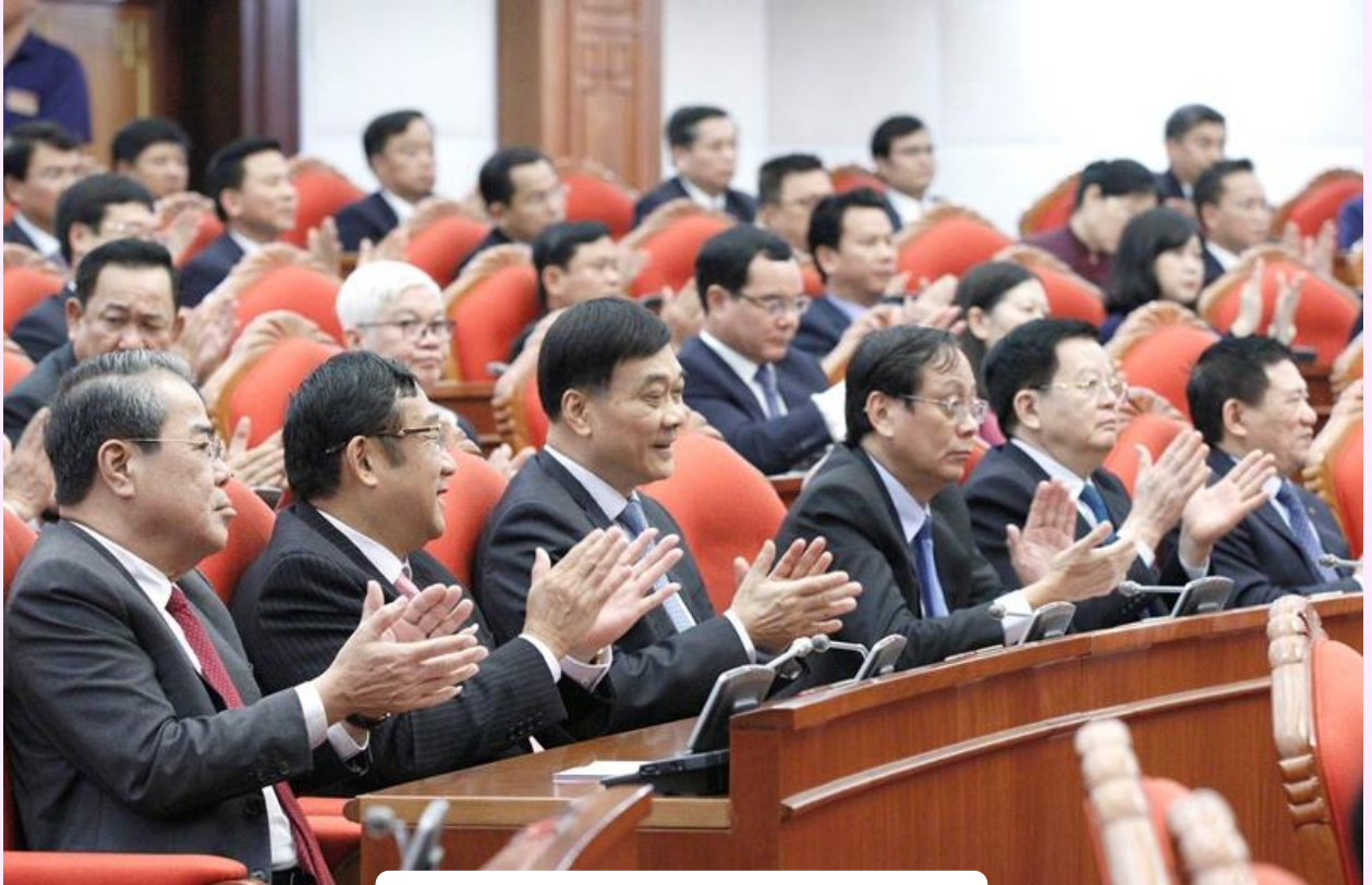
Các đại biểu tại phiên bế mạc.

Ban Chấp hành Trung ương Đảng yêu cầu các Tiểu ban văn kiện nghiêm túc tiếp thu ý kiến của Hội nghị, khẩn trương