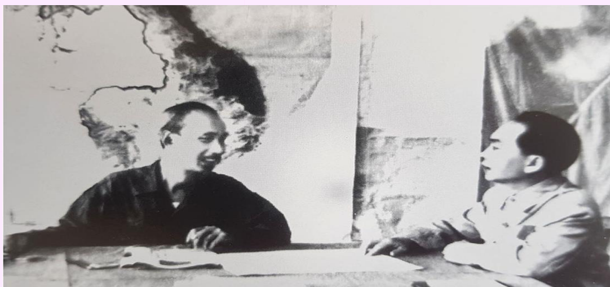
Thay mặt Trung ương Đảng và Chính phủ, Hồ Chủ tịch trực tiếp giao nhiệm vụ cho Đại tướng Võ Nguyên Giáp nghiên cứu kế hoạch tác chiến và mở Chiến dịch Điện Biên Phủ.

Quyết định thay đổi phương châm tác chiến dẫn đến việc kéo pháo ra là một thử thách không nhỏ với các cán bộ, chiến sĩ pháo binh. Quyết định đó đã gây xáo trộn lớn về tư tưởng bởi bao nhiêu mồ hôi và xương máu của hàng ngàn con người đã đổ xuống trên đường kéo pháo, bao nhiêu gian khổ đã vượt qua,... giờ lại phải kéo pháo ra. Trước tình hình đó, cấp ủy các đơn vị đã