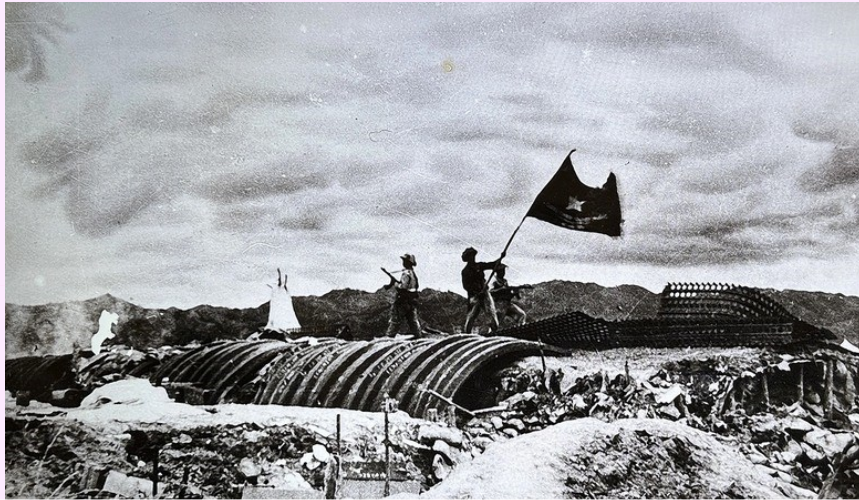
Cờ Quyết chiến quyết thắng tung bay trên nóc hầm Tướng De Castries tại Điện Biên Phủ (07/5/1954)

chiến lược cách mạng: Cách mạng xã hội chủ nghĩa ở miền Bắc và cách mạng dân tộc dân chủ Nhân dân ở miền Nam thực