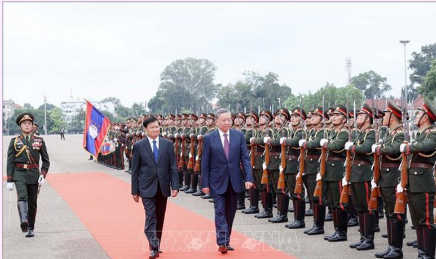
Chủ tịch nước Tô Lâm và Tổng Bí thư, Chủ tịch nước Lào Thongloun Sisoulith duyệt Đội danh dự

Hai bên nhất trí cao về các biện pháp để tiếp tục triển khai hiệu quả các thỏa thuận cấp cao của hai Đảng, hai Nhà nước, góp phần tạo động lực mới, thúc đẩy mạnh mẽ hơn nữa quan hệ giữa hai nước trong thời gian tới; trong đó, tiếp tục quan tâm, chú trọng vào các lĩnh vực quốc phòng - an ninh, kinh tế - thương mại - đầu tư, giáo dục - đào tạo, văn hóa và giao lưu nhân dân. Trên cơ sở đó, hai bên nhất trí phối hợp triển khai hiệu quả Thỏa thuận Chiến lược hợp tác Việt Nam - Lào giai đoạn 2021 - 2030 và Hiệp định về hợp tác song phương Việt Nam - Lào giai đoạn 2021 -