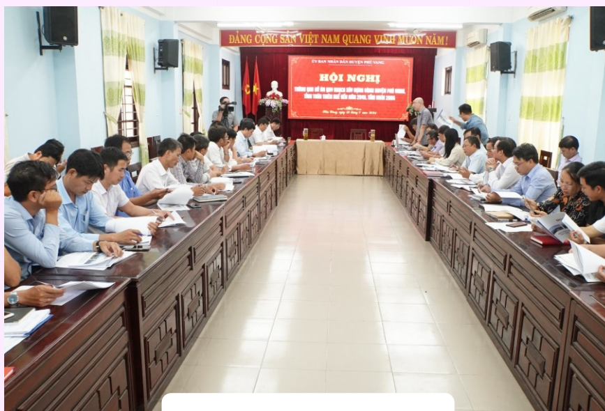
Tại Hội nghị