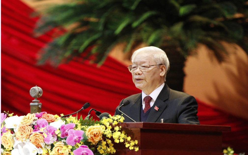
Tổng Bí thư Nguyễn Phú Trọng

T ổng Bí thư Nguyễn Phú Trọng, một trí tuệ lớn, tài năng lớn của cách mạng Việt Nam, nhà tư tưởng, nhà văn hóa, ngọn cờ lý luận của Đảng, người học trò xuất sắc không ngừng học tập, làm theo tư tưởng, đạo đức, phong cách của Chủ tịch Hồ Chí Minh vĩ đại, đã cống hiến trọn đời mình cho sự nghiệp cách mạng của Đảng và dân tộc ta, sống trọn cuộc đời vì nước, vì dân.