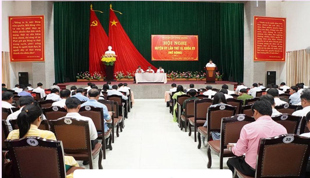
Tại Hội nghị

nghiệp hàng hóa theo chuỗi giá trị trên địa bàn huyện”; tổng kết 10 năm thực hiện Nghị quyết số 33-NQ/TW, ngày 09/6/2014 của Ban Chấp hành Trung ương (khóa XI)