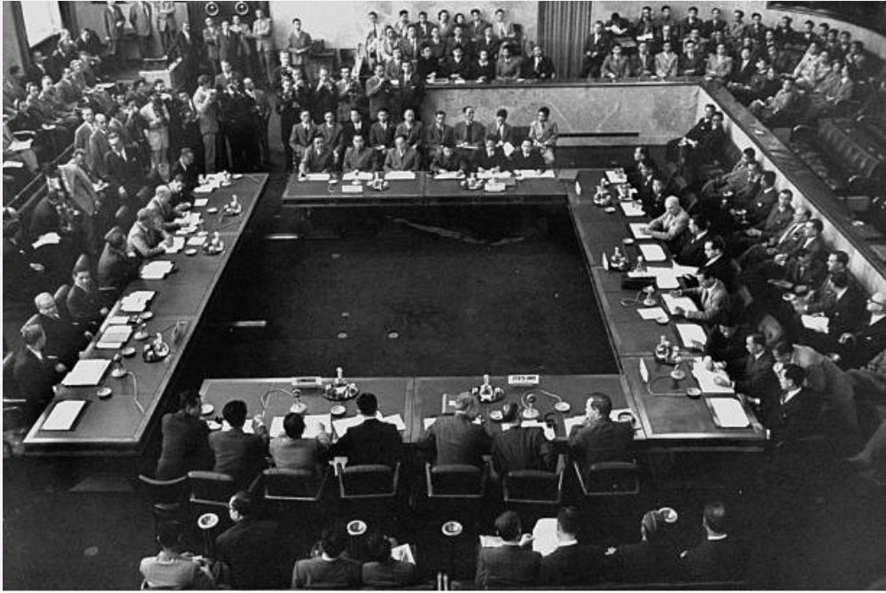
Hội nghị Gionevơ (Thụy Sĩ) năm 1954 bàn về lập lại hòa bình ở Đông Dương

T ròn 70 năm đã trôi qua kể từ khi Hiệp định Geneve được ký kết (1954 - 2024), nhưng những bài học kinh nghiệm đúc rút từ quá trình đàm phán, thương lượng đi đến ký kết Hiệp định Geneve năm 1954 vẫn còn nguyên giá trị trong sự nghiệp xây dựng và bảo vệ Tổ quốc Việt Nam xã hội chủ nghĩa hiện nay.