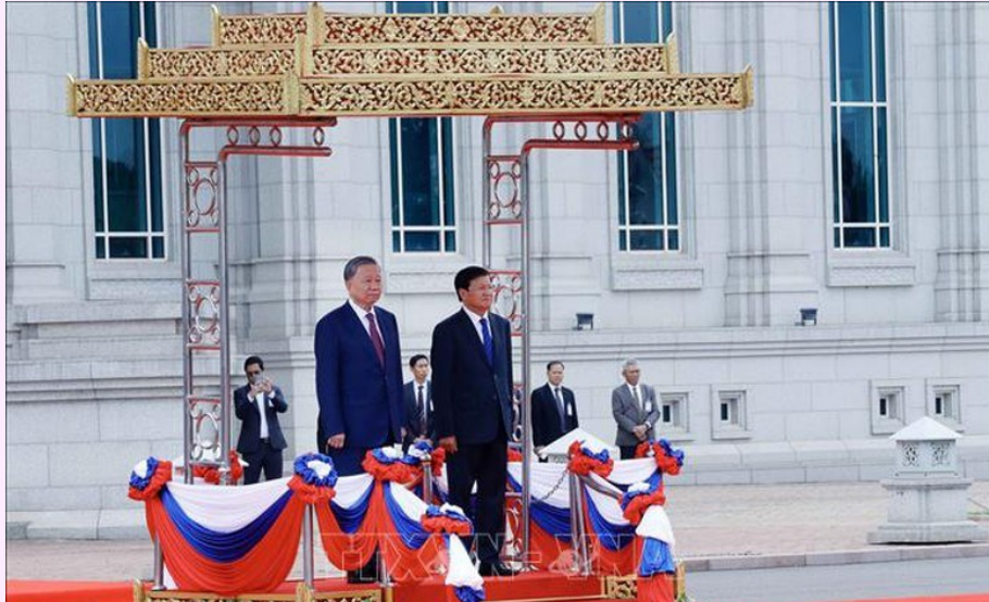
Chủ tịch nước Tô Lâm và Tổng Bí thư, Chủ tịch nước Lào Thongloun Sisoulith trên bục danh dự, nghe quân nhạc cử Quốc thiều hai nước

N hận lời mời của Tổng Bí thư, Chủ tịch nước CHDCND Lào Thongloun Sisoulith và Quốc vương Campuchia Norodom Sihamoni, Chủ tịch nước Tô Lâm cùng Đoàn đại biểu cấp cao Việt Nam đã thăm cấp Nhà nước tới CHDCND Lào và Vương quốc Campuchia từ ngày 11 - 13/7/2024.