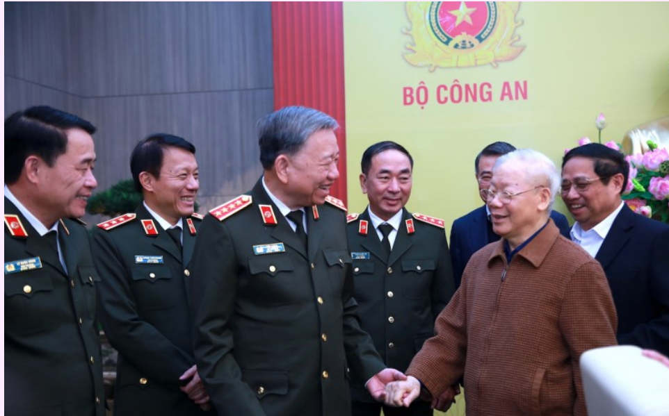
Tổng Bí thư Nguyễn Phú Trọng với các đại biểu dự Hội nghị Đảng ủy Công an Trung ương tháng 12/2023

trường kinh tế đi đôi với thực hiện tiến bộ và công bằng xã hội ngay trong từng bước, từng chính sách và trong suốt quá trình phát triển” (6) , “mỗi chính sách kinh tế đều phải hướng tới mục tiêu phát triển xã hội..., khuyến khích làm giàu hợp pháp đi đôi với xóa đói giảm nghèo, chăm sóc người có công, những người không may