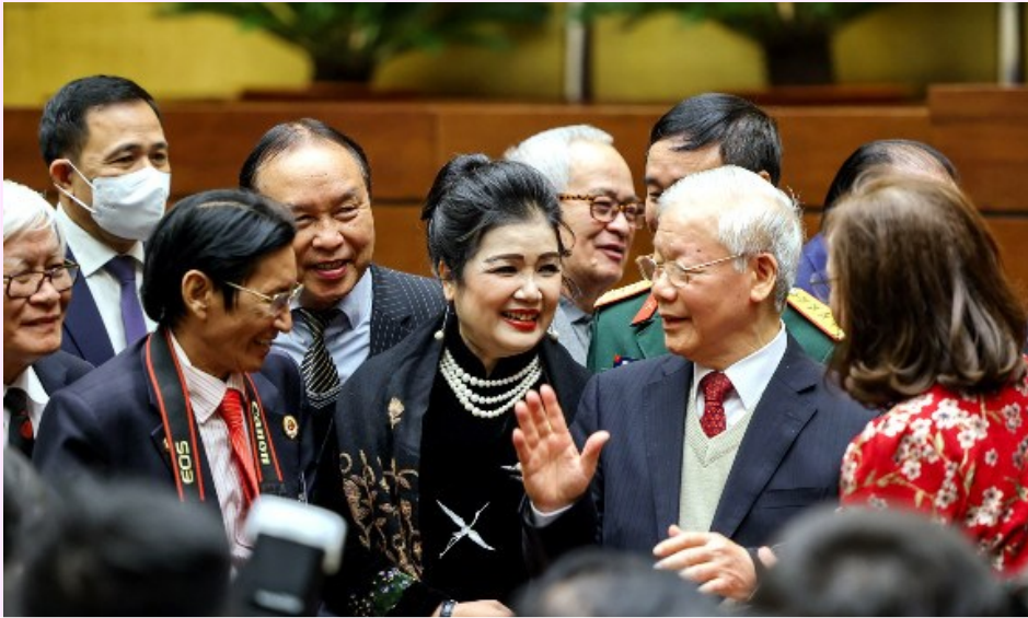
Tổng Bí thư Nguyễn Phú Trọng trò chuyện với các đại biểu tham dự Hội nghị văn hóa toàn quốc tại Nhà Quốc hội, ngày 24/11/2021

quyết về tiếp tục xây dựng và hoàn thiện Nhà nước pháp quyền xã hội chủ nghĩa