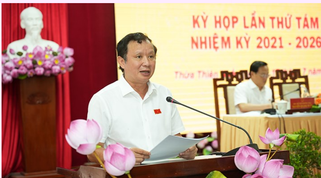
Ủy viên Trung ương Đảng, Bí thư Tỉnh ủy, Chủ tịch HĐND tỉnh, Trưởng đoàn đại biểu Quốc hội tỉnh Lê Trường Lưu phát biểu bế mạc kỳ họp

S áng ngày 17/7, sau 1,5 ngày làm việc khẩn trương, nghiêm túc, với tinh thần đoàn kết, dân chủ và trách nhiệm cao, kỳ họp thường lệ lần thứ 8 của HĐND tỉnh đã hoàn thành toàn bộ nội dung, chương trình đề ra.