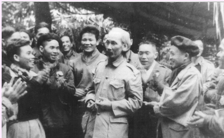
Hồ Chủ tịch nói chuyện với đại biểu dự Đại hội Đảng toàn quốc lần II, tháng 02/1951

người cách mạng chân chính, không có gì là khó cả. Điều đó hoàn toàn do lòng mình