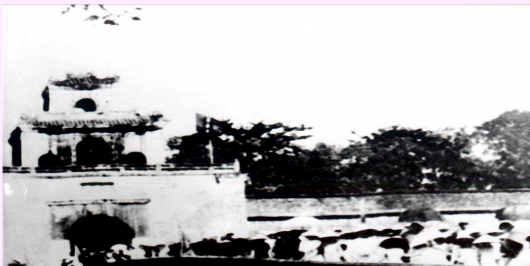
Nhân dân Thừa Thiên Huế tham gia giành chính quyền và kéo vào cửa Thượng Tứ Huế ngày 23/8/1945