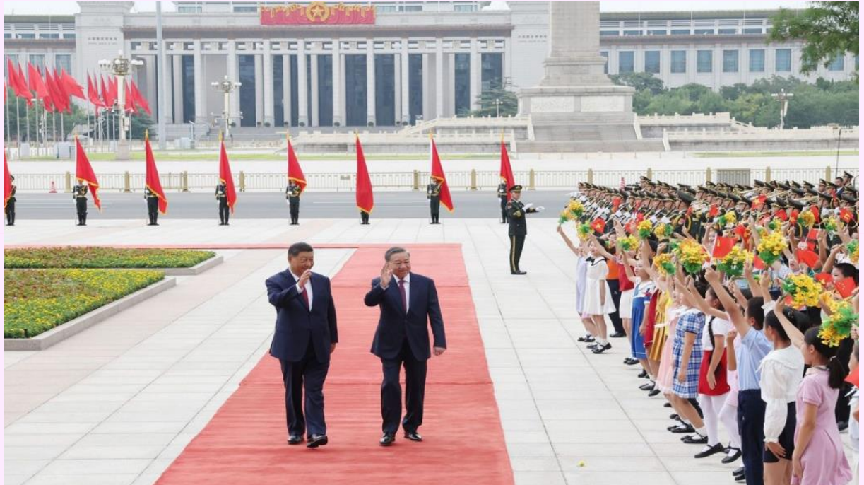
Tổng Bí thư, Chủ tịch nước Tô Lâm và Tổng Bí thư, Chủ tịch nước Trung Quốc Tập Cận Bình tại lễ đón trọng thể ở Bắc Kinh ngày 19/8

N hận lời mời của Tổng Bí thư Ban Chấp hành Trung ương Đảng Cộng sản Trung Quốc, Chủ tịch nước Cộng hòa Nhân dân Trung Hoa Tập Cận Bình, Tổng Bí thư Ban Chấp hành Trung ương Đảng Cộng sản Việt Nam, Chủ tịch nước Cộng hòa xã hội chủ nghĩa Việt Nam Tô Lâm thăm cấp Nhà nước tới Trung Quốc từ ngày 18 đến ngày 20/8/2024.