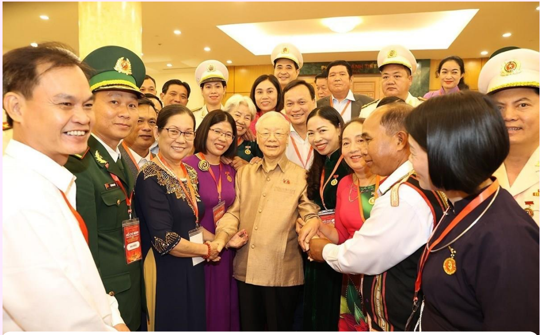
Cố Tổng Bí thư Nguyễn Phú Trọng với các đại biểu dự Hội nghị biểu dương Chủ tịch Mặt trận Tổ quốc cấp xã và trưởng ban công tác Mặt trận tiêu biểu toàn quốc

S inh thời, Chủ tịch Hồ Chí Minh luôn đề cao sự cần thiết và vai trò của việc nêu gương đối với mỗi cán bộ, đảng viên. Nêu gương được Người coi là một trong những cách thức quan trọng để cán bộ, đảng viên phát huy trách nhiệm của mình trước Đảng, trước Nhân dân. Tư tưởng đó của Người có ý nghĩa lý luận và thực tiễn sâu sắc, nhất là trong xây dựng, chỉnh đốn Đảng giai đoạn hiện nay.