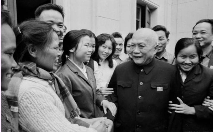
Chủ tịch Tôn Đức Thắng nói chuyện với đại biểu dự Kỳ họp thứ 3, Quốc hội khóa IV (20 - 23/2/1973), tại Hội trường Ba Đình.

C hủ tịch Tôn Đức Thắng - nhà lãnh đạo mẫu mực, người cộng sản kiên trung, người bạn chiến đấu thân thiết của Chủ tịch Hồ Chí Minh vĩ đại, tấm gương đạo đức cách mạng sáng ngời - suốt đời phấn đấu, hy sinh vì sự nghiệp đấu tranh giải phóng dân tộc, thống nhất đất nước, xây dựng và bảo vệ Tổ quốc Việt Nam xã hội chủ nghĩa.