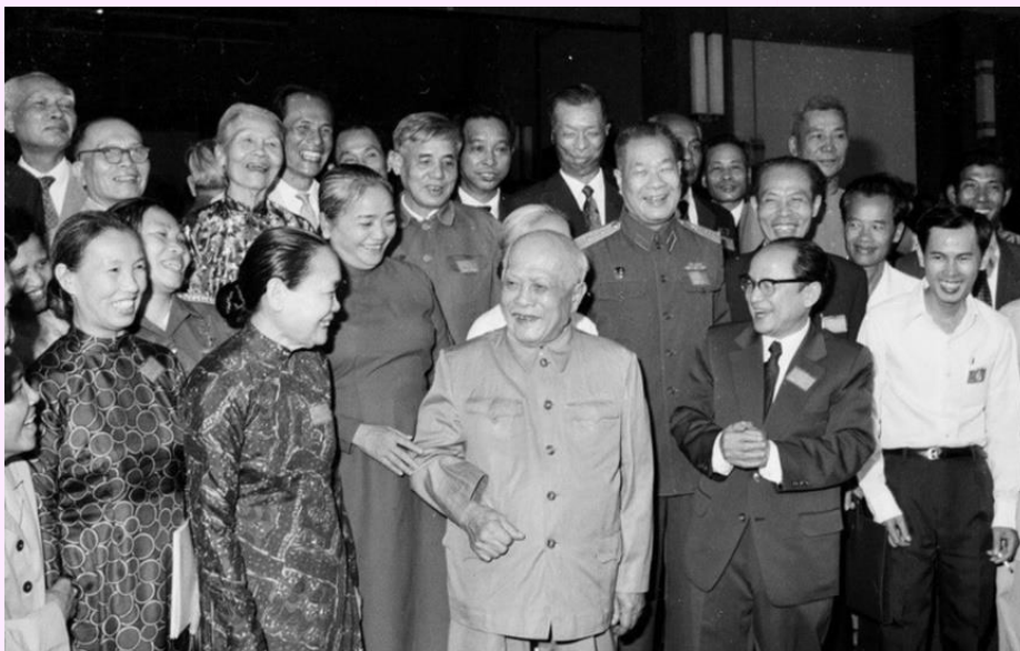
Chủ tịch Tôn Đức Thắng và các đại biểu dự Đại hội Mặt trận thống nhất Việt Nam, ngày 31/1/1977.

che thân hứng chịu những trận đòn roi tàn bạo của kẻ thù để che chở cho đồng chí, đồng đội đã tạo sự cảm phục, tin yêu đối với tù nhân. Đồng chí đã tổ chức sáng lập Chi bộ đặc biệt ở Nhà tù Côn Đảo và trở thành một trong những người lãnh đạo của các tù nhân Côn Đảo. Cùng với các chiến sĩ cộng sản khác, Đồng chí đã tích cực đấu tranh đòi cải thiện điều kiện sinh hoạt và