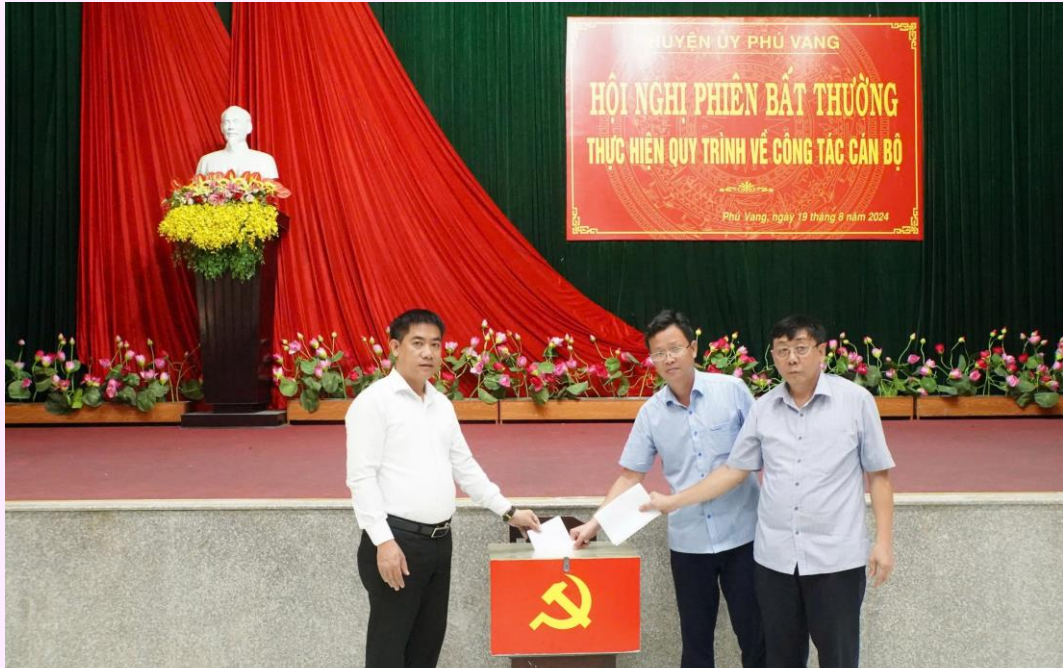
Các đồng chí Thường trực Huyện ủy thực hiện quy trình bổ sung Ban Chấp hành